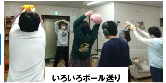
いろいろボール送り