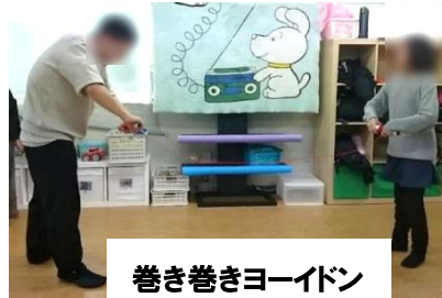
巻き巻きヨーイドン