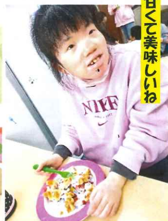
甘くて美味しいね