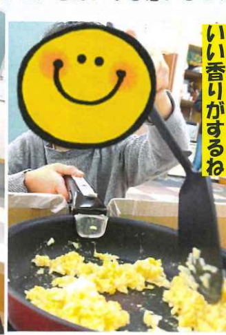
いい香りがするね