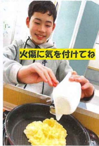
火傷に気を付けてね