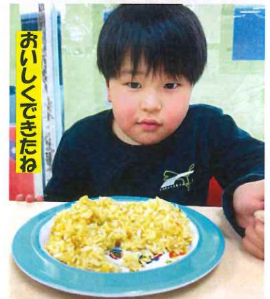
おいしくできたね